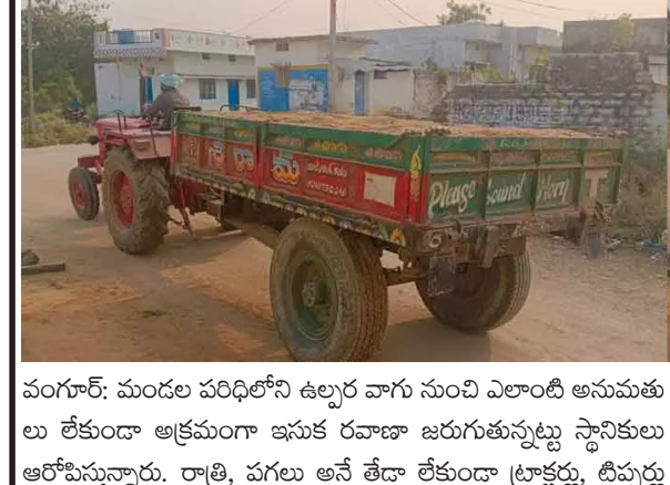
వంగూర్: మండల పరిధిలోని ఉల్లార వాగు నుంచి ఎలాంటి అనుమతులు లేకుండా అక్రమంగా ఇసుక రవాణా జరుగుతున్నట్లు స్థానికులు ఆరోపిస్తున్నారు. రాత్రి, పగలు అనే తేడా లేకుండా ట్రాక్టర్లు, టిప్పుర్లు

ఉపయోగించి పెద్ద ఎత్తున ఇసుకను తరలిస్తున్నారని గ్రామస్థులు తెలిపారు. ప్రభుత్వ నిబంధనలను పూర్తిగా పక్కనపెట్టి కొందరు వ్యక్తులు అక్రమంగా ఇసుక తవ్వకాలు నిర్వహిస్తూ, ప్రభుత్వ ఆదాయానికి భారీ నష్టంకలిగిస్తున్నారని వారు పేర్కొన్నారు. ఇసుక అక్రమరవాణా కారణంగా వాగు పరిసర ప్రాంతాల్లో పర్యావరణానికి కూడా తీవ్ర నష్టం కలుగుతోందని స్థానికులు ఆందోళన వ్యక్తం చేస్తున్నారు. సంబంధిత అధికారులు ఈ విషయాన్ని గమనించినప్పటికీ చర్యలు తీసుకోవడంలో నిర్లక్ష్యం చూపుతున్నారని ప్రజలు విమర్శిస్తున్నారు. ఇప్పటికైనా మైనింగ్, రెవెన్యూ, పోలీస్ శాఖ అధికారులు స్పందించి అక్రమ ఇసుక రవాణాపై కఠిన చర్యలు తీసుకోవాలని గ్రామస్థులు డిమాండ్ చేస్తున్నారు. అలాగే ఉల్లార వాగు నుంచి జరుగుతున్న ఇసుక తవ్వకాలను వెంటనే నిలిపివేసి, బాధ్యులపై కేసులు నమోదు చేయాలని కోరుతున్నారు.